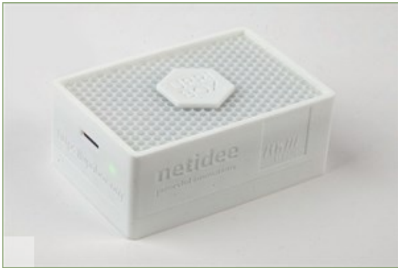
Die Alphaversion der Upribox.