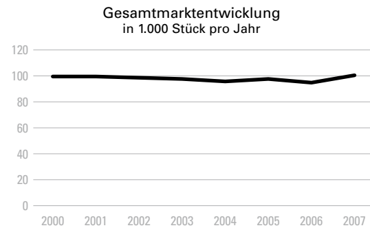
Abbildung 2: „Marktentwicklung stabil“ Die gesamte Werteskala wird dargestellt und spiegelt die eigentliche Entwicklung der Datenwerte wider. Diese Abbildung zeigt die exakt gleichen Datenwerte wie Abbildung 1.

zu verhindern, muss für die LeserInnen erkennbar sein, dass nur ein Teil des Wertebereichs abgebildet ist. Eine verkürzte Skala ist nur dann zielführend, wenn die primäre Absicht darin besteht, geringfügige Entwicklungen bzw. minimale Differenzen zwischen Datenkategorien aufzuzeigen. Denn geringe Unterschiede der Datenwerte sind bei der Darstellung der Gesamtheit eines großen Wertebereichs oft nur mehr schwer erkennbar (Abb. 2).